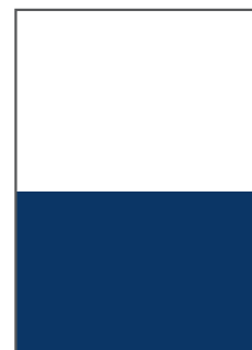
1/2 SEITE QUER B 210 MM X H 145 MM PREIS: 679,- EURO