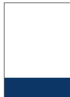
1/4 SEITE QUER B 210 MM X H 71 MM PREIS: 439,- EURO