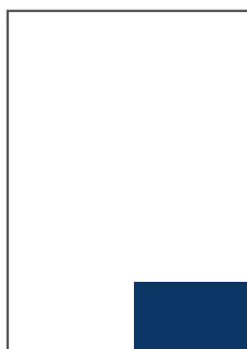
1/8 SEITE QUER B 101 MM X H 71 MM PREIS: 289,- EURO