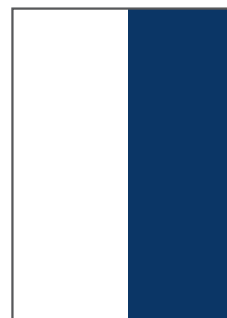
1/2 SEITE HOCH B 101 MM X H 297 MM PREIS: 679,- EURO